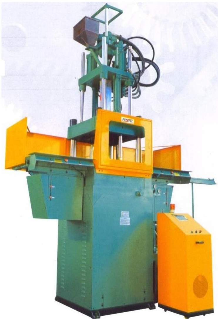
Serie: FT-2100DS Fuerza de Cierre: 210Ton Peso de Inyección: 322-548g